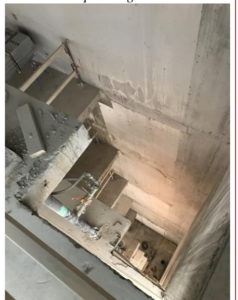
Uppsågat bjälklag/ blivande hisschakt