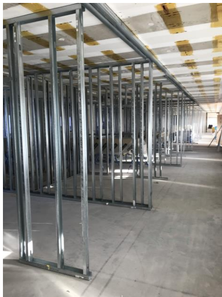
Uppregling av innerväggar