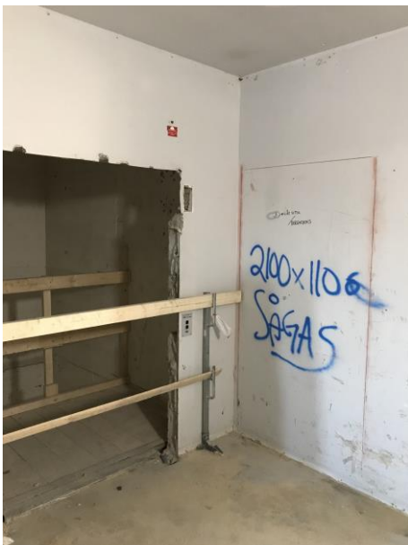
Ny dörröppning som ska sågas