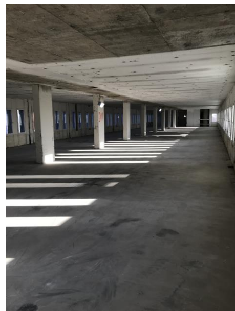
Yta för lägenheter efter lätt rivning